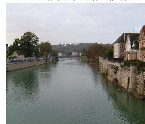
Courcelles sous Jouarre