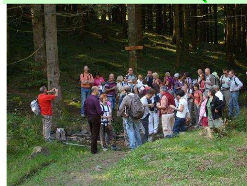
WE en Belgique