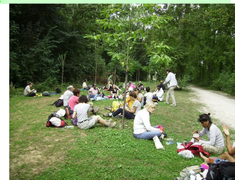
Entre Morin et Marne