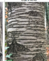
h) lisse, stries horizontales, fond foncé