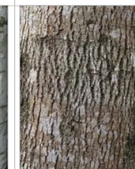
j) très régulière avec crevasses fines