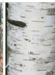
i) lisse, stries horizontales, fond blanc