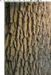
a) crevasses profondes de longueur limitée