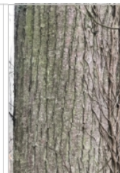
b) surface plane à nervures régulières